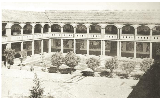
Figura 2: Patio del edificio principal de la escuela de Warisata con los murales de Illanes