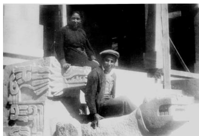
Figura 4: Pabellón México (detalle).