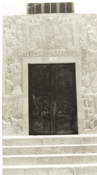
Figuras 5 y 6: Portales del Pabellón México con lemas