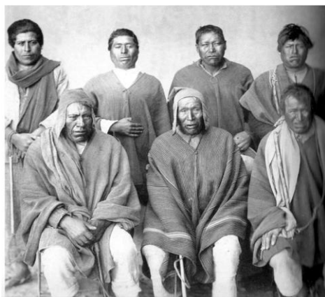
Figura 13: Miembros de la Ulaka de Warisata