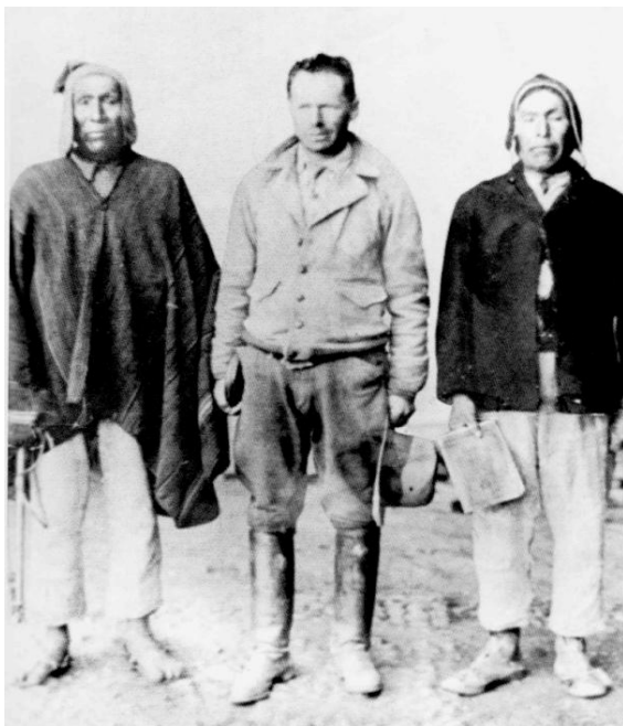
Figura 1: Los fundadores de Warisata: Elizardo Pérez (al medio) y Avelino Siñani (derecha)

prácticas agropecuarias como la formación artística en talleres de artesanía, pintura, música, etc. 5