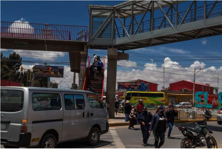
Av. 6 de Marzo esq. Tiahuanacu, El Alto "Ch'enko 11"