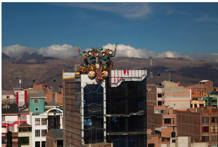
“Cholet” en Villa Dolores, El Alto “Ch’enko 17”