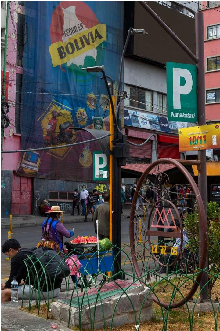
Calle Bueno, La Paz "Ch'enko 13"