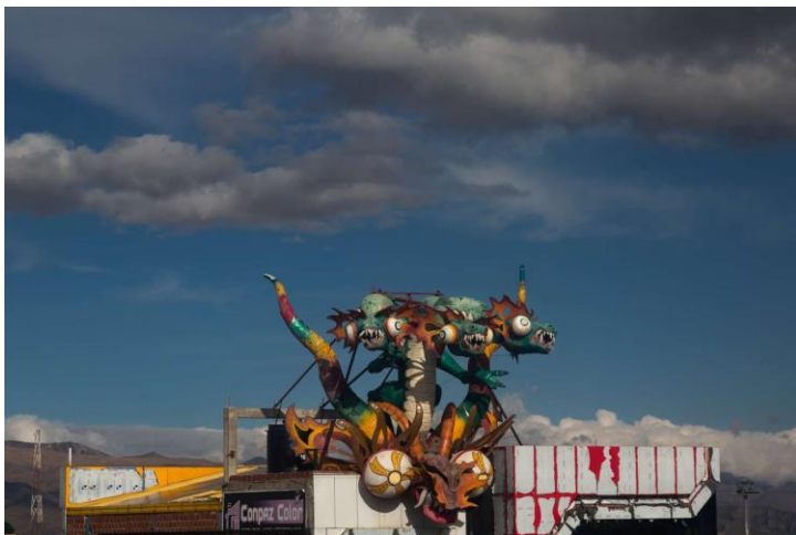
Primer plano "Cholet", El Alto "Ch'enko 18"