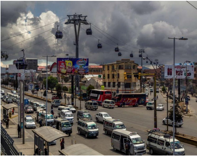
Av. 6 de Marzo, El Alto "Ch'enko 9"