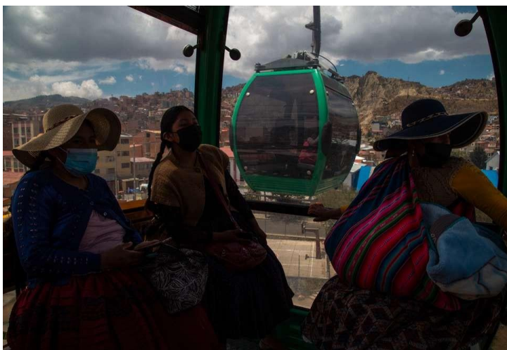
Teleférico línea verde, La Paz "Ch'enko 8"