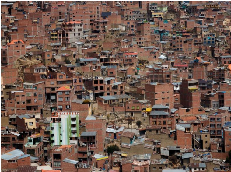
Ladera, La Paz "Ch'enko 2"