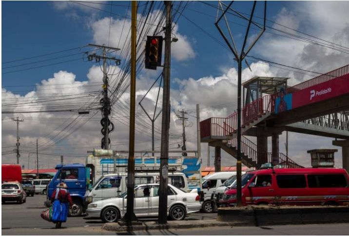
Av. 6 de Marzo, El Alto "Ch'enko 4"