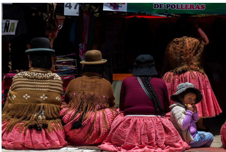
Plaza de La Cruz, El Alto "Ch'enko 15"