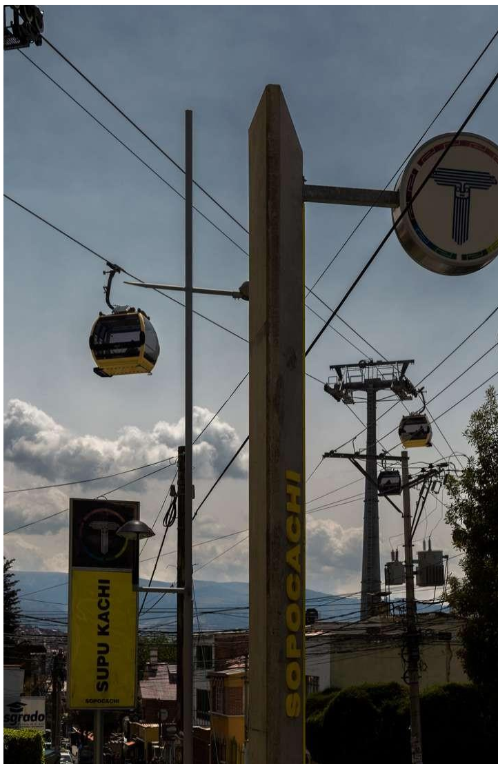
Estación de teleférico amarillo - Sopocachi, La Paz "Ch'enko 5"