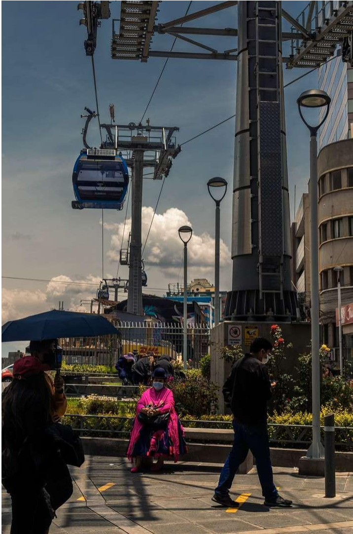
Estación de teleférico azul - Centro, La Paz "Ch'enko 6"