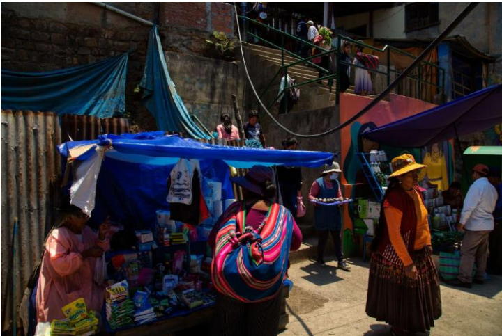
Mercado popular, Coroico "Ch'enko 12"