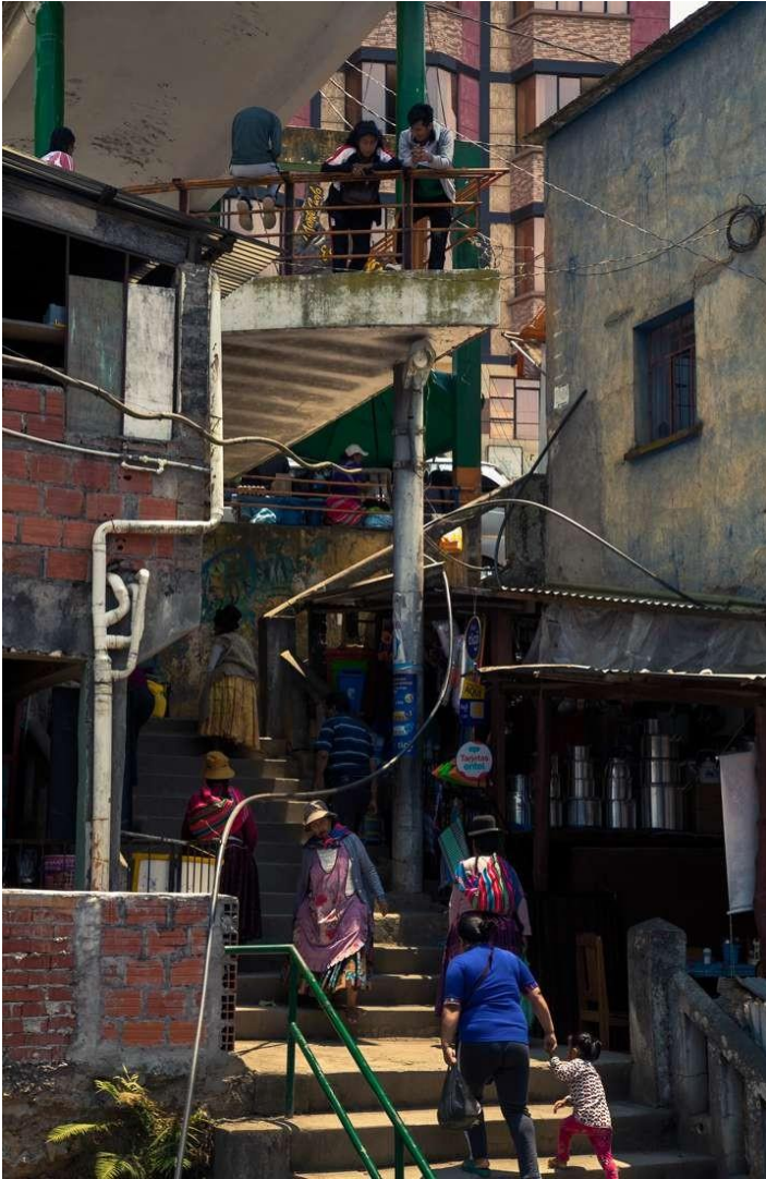
Gradas al Mercado, Coroico "Ch'enko 14"