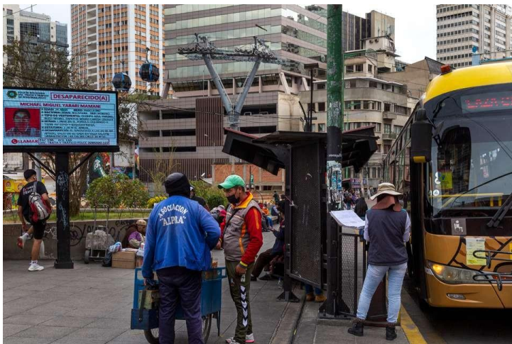
Av. Camacho esq. Bueno, La Paz "Ch'enko 7"