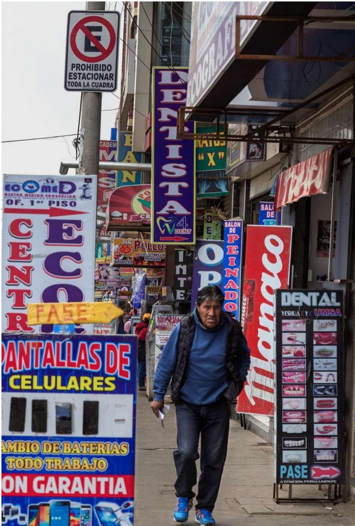
Av. Bolivia, El Alto "Ch'enko 16"