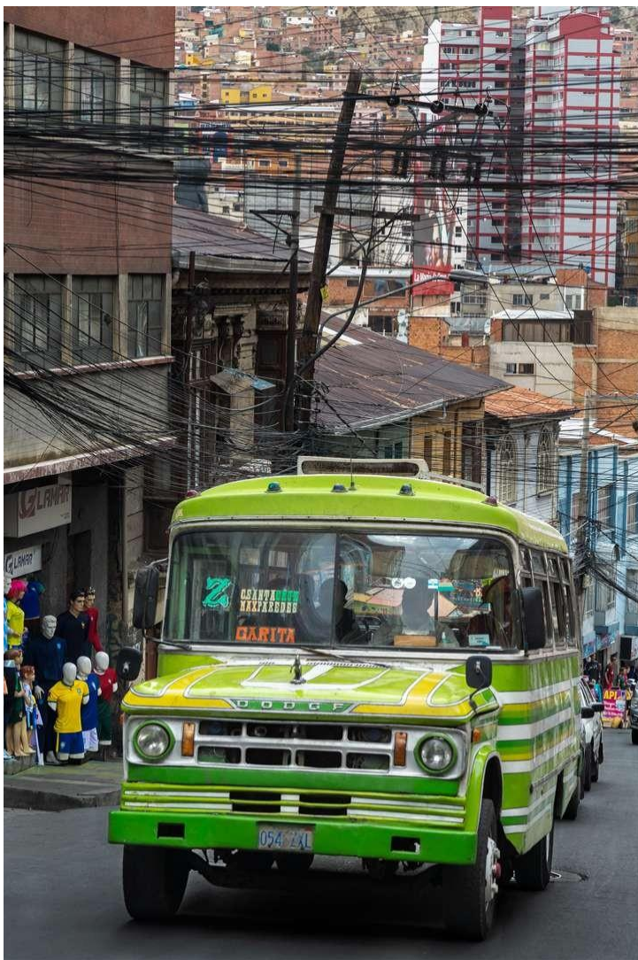
Calle Santa Cruz, La Paz "Ch'enko 10"